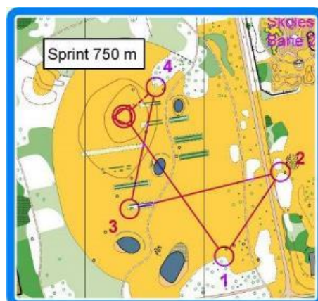
Eksempel på en Sprintbane