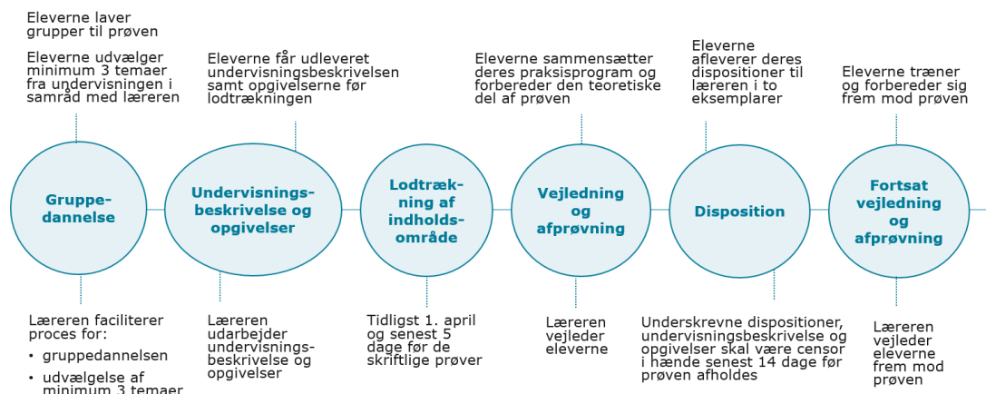
Figur 2 Prøvedagen