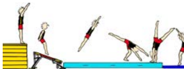
Raketbane (fx til vejrmølle, rondat og kraftspring)

Alle illustrationer er lavet med brug af Sportsplanner