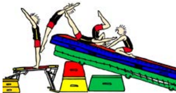
Forhøjet landing (fx til forlæns og baglæns salto)