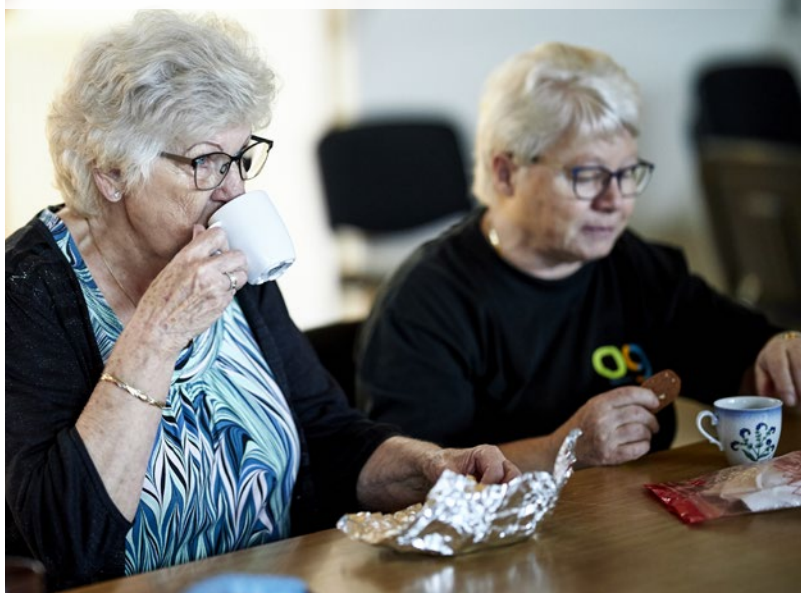
Flere af deltagerne kører 20-30 kilometer for at komme til gymnastik. Det skyldes ikke mindst sammenholdet og det sociale liv

»Højdepunktet var, da jeg fik et herremotionshold i Dianalund i 1980. Jeg har været i 18 forskellige foreninger, men det hold var toppen. Jeg kunne få dem til alt, og de var med på det mest skøre. Kvinder går så meget op i, hvordan de tager sig ud, men mændene kaster sig bare ud i alle mulige sjove ting.«